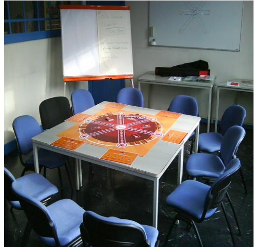
Le plateau et son matériel