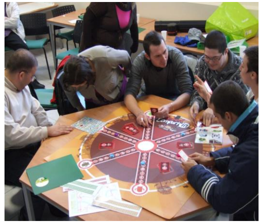
Epreuves questions et défis